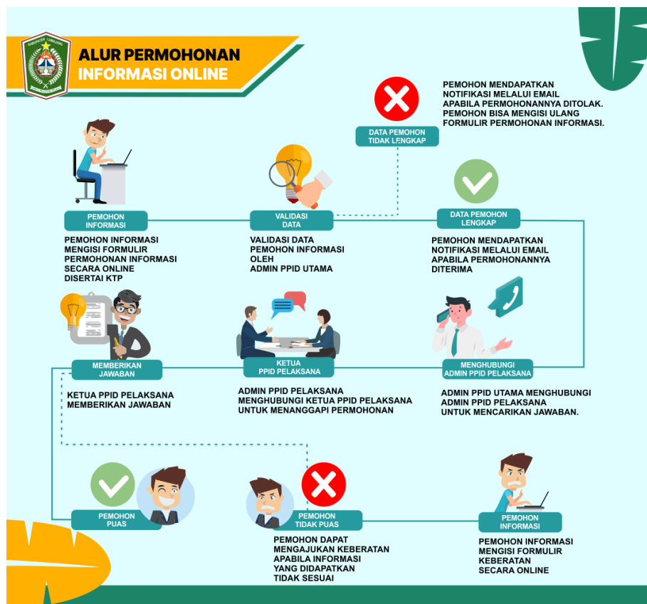
Gambar: 2.1 Alur Permintaan Informasi KECAMATAN KUNIR Tahun 2025